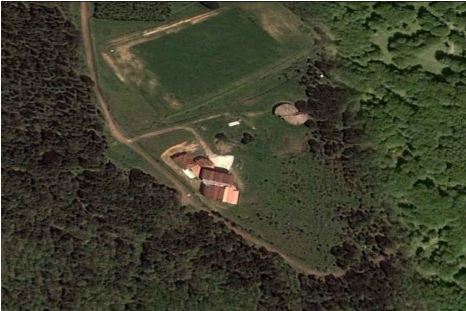
VISTA AEROFOTOGRAMMETRICA Scala 1: 2000